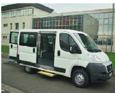
MINICAR du SIVOM adapté